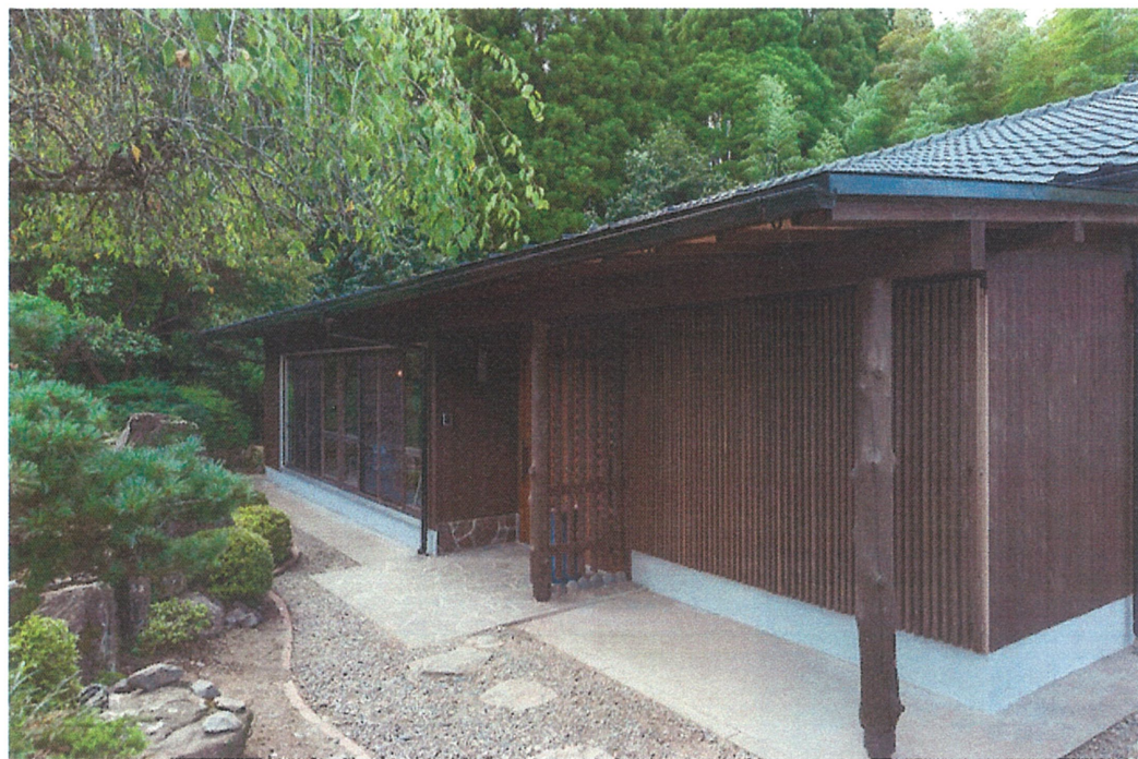
和のイメージの玄関